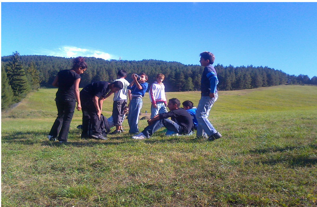
Obrázok 1: Branné cvičenie v prírode

Na brannom cvičení v prírode sme sa mohli hrať v prírode, opekať špekáčky a oddýchnuť si. Mali sme veľmi dobré slnečné počasie od rána až do obeda. Zabávali sme sa a súťažili. Bolo dobre byť na čerstvom vzduchu celý deň. Niektorí žiaci hrali futbal na veľkom ihrisku v Kišovciach. Potom nám veľmi chutil obed v jedálni :-)